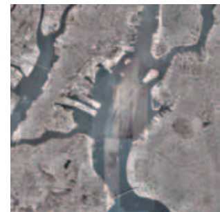
(아래) 펠리세이드 베이(Palisade Bay)