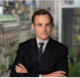
배리 벅돌(Barry Bergdoll), 모마 건축과 디자인 수석 큐레이터

세계의 많은 지역, 특히 네덜란드에서는 디자이너들이 하드와 소프트 인프라스트럭처를 담당하는 수력 공학자들과 기후 과학자들과 함께 손잡는 전통이 있다. 하지만 미국은 이런 맥락에서 현저히 느리다. 지금까지의 기후변화에 대한 토론은 탄소 배출량의 문제에 크게 집중돼 있다. 이미 진행되고 있는 과정들의 모든 지식을 통해서 문제들을 해소하지 못하고 단지 완화시킬 수 있었다. 지난 2005년 ‘허리케인 카트리나(Hurricane Katrina)’의 효력이 비극적인 예시로 생생하게 남아있다. 교통수단에 수반되는 모든 문제들과 함께 해안 지역들의 조경을 매일 새롭게 디자인하는 작업이 필요해짐에 따라 학문적인 스튜디오에서 많은 작업들이 이뤄졌다. 앞서 말했듯 2008년 가을부터 집중된 경제 위기는 많은 디자이너들을 한가하게 만들었을 뿐 아니라 오바마 행정부의 경기 부양 정책 아래 인상적인 기반 시설들이 투자되는 결과를 낳았다. 시민들이 다시 일할 수 있게 하고 사회간접자본에 대한 대대적인 투자 프로젝트인 ‘셔블-레디(Shovel-Ready)’에 경제적 관심과 자원을 집중할 수 있도록 자극하는 긴급한 필요가 있었다. 특히 인도양의 몰디브 해안이 몇 년 안에 사라질 운명에 처했다는 소식은 현재 상황을 극도로 보게 하는 만큼 환경적 문제에 대한 해결책들을 찾으려는 노력은 계속될 것이다. 예를 들어 ‘팰리세이드 베이’팀은 격렬하지 않고 간단한 방법으로 문제를 방어할 수 있는 대안들을 제시했고, 현실적인 조사들과 이상적인 주관의 합의를 찾으려 시도했다. ‘떠오르는 흐름: 뉴욕의 해안가를 위한 프로젝트들’을 통해서도 디자인의 문제 해결 능력과 디자이너의 역할과 가능성에 대해 다시 한 번 확인할 수 있을 것이다.